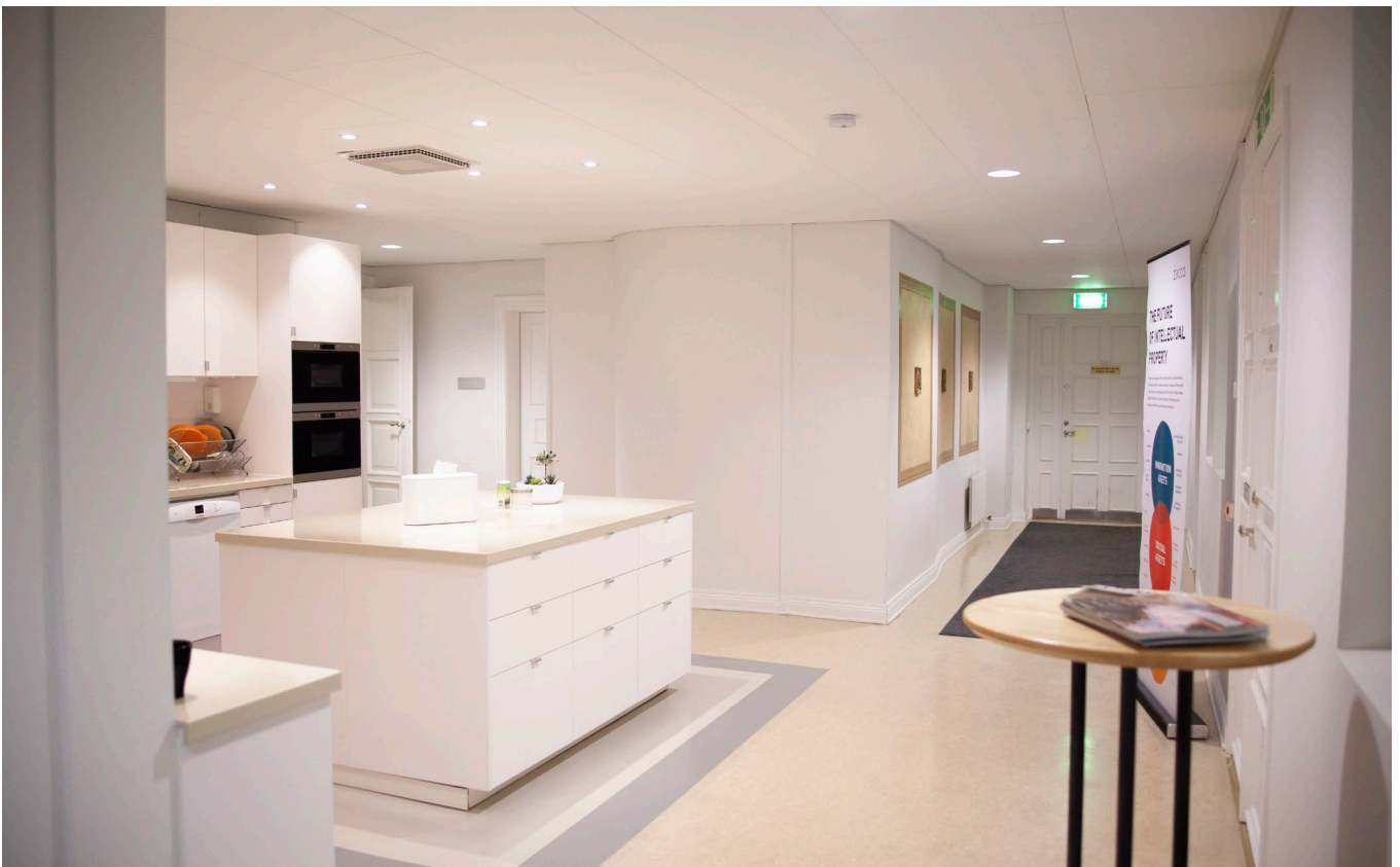
Kyrksalen, kontorsrummen och köket.