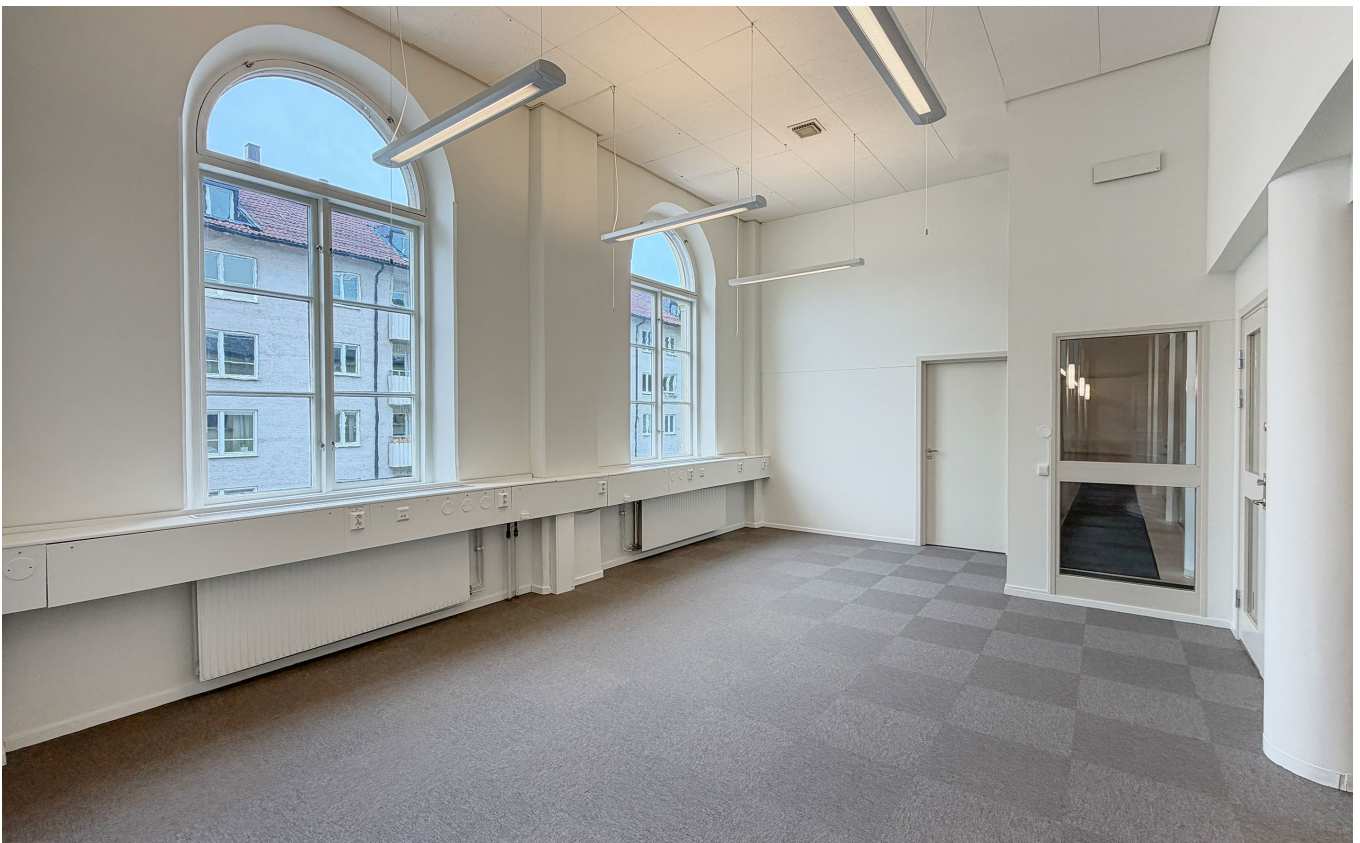
Förråd, fönster och rum 105E.