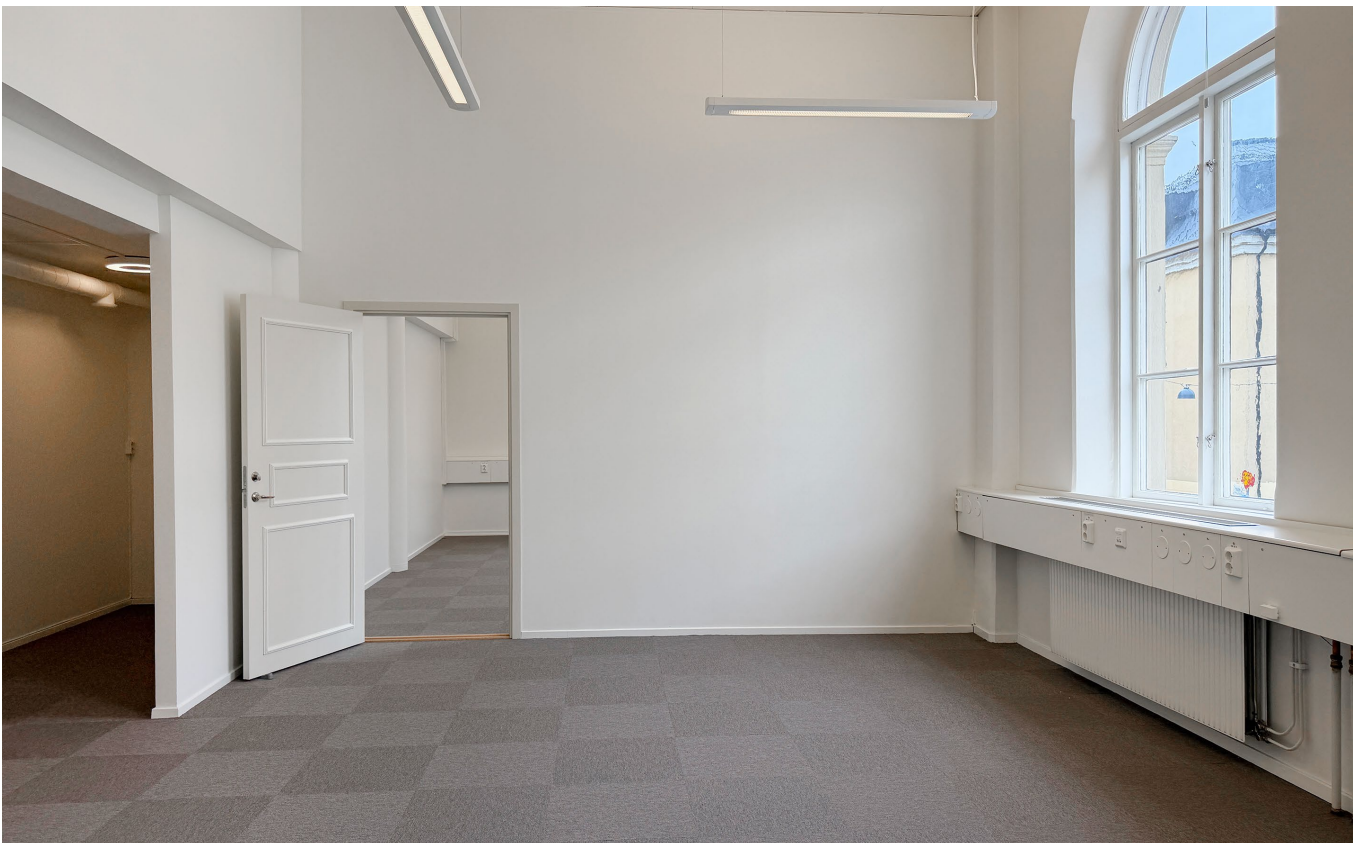
Rum 105F och rum 105E.